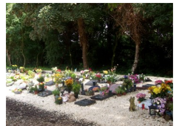
Algemene graven (Holy)

Verlenging van de termijn van particuliere (urnen)graven en -nissen is mogelijk.