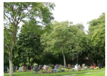
Particuliere graven (Holy)