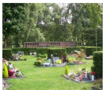
Urrentuin en urnenmuur (Holy)