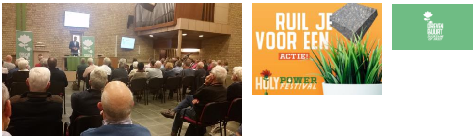
Bewonersavond The Next Generation Woonwijk Holy

Wonen in een duurzame woning in een wijk waar inwoners zich met elkaar verbonden voelen en waar alle generaties een hoge kwaliteit van leven ervaren. De gemeente Vlaardingen brengt inwoners en partijen bij elkaar om te bouwen aan een duurzame woonwijk. De gemeente Vlaardingen ondersteunt en verbindt. De Drevenbuurt is een onderdeel van de Next Generation woonwijk Holy. Hier worden lokale initiatieven gebundeld op het gebied van duurzaamheid, economie en sociale cohesie. Buurtbewoners streven samen naar een duurzame toekomst.