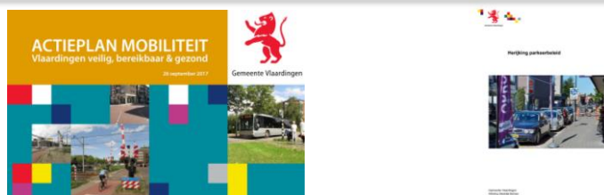
Actieplan Mobiliteit en herijking Parkeerbeleid

Inwoners worden actief betrokken bij de totstandkoming van beleid, zoals mobiliteit en parkeren. O.a. is het beleid voor Parkeren ontwikkeld op basis van dialoog en enquêtes bij ca. 10.000 huishoudens.