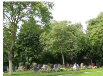
Particuliere graven (Holy)