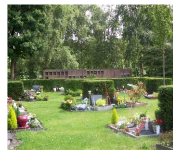
Urmentuin en urnenmuur (Holy)