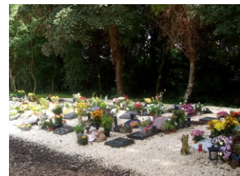
Algemene graven (Holy)